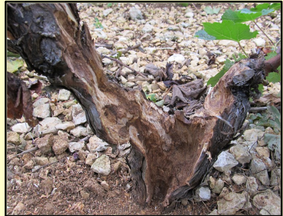
Un cep cureté

Afin de tester l'efficacité du curetage sur les cépages bourguignons et dans le contexte régional, nous vous proposons de remplir une fiche de suivi des ceps curetés. Ces fiches permettront de connaître le taux de réussite du curetage pour chaque domaine participant au projet. Ceci permettra d'obtenir des données pour une grande diversité de parcelles et de contextes dans la région.